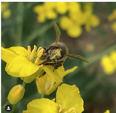
BUTTINEUSES AU TRAVAIL Sur le pissenlit et sur le colza